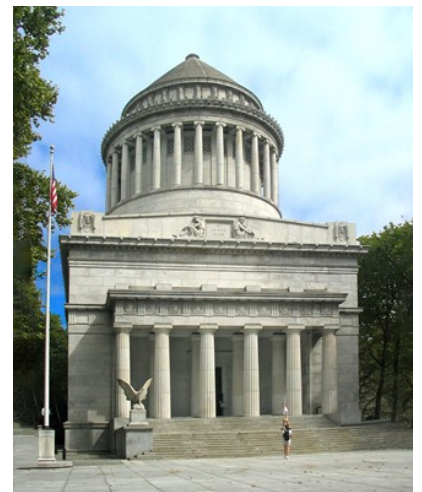
National Memorial und Grabstätte von U. S. Grant in Grant's Tomb, New York. Es ist das größte Mausoleum Nordamerikas