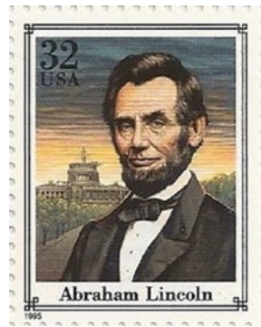
Briefmarke Michel Nr. 2592 aus demselben Block