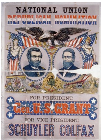
Wahlplakat 1868 für die Republikaner, mit Ulysses S. Grant als Präsidentschaftskandidat, interessanterweise in seiner General-Uniform.