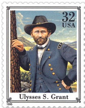
Briefmarke Michel Nr. 2584 aus dem Block Persönlichkeiten und Darstellungen des amerikanischen Bürgerkrieges 1861-1865 erschienen am 29. Juni 1995