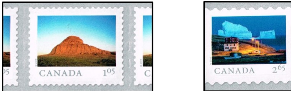
Abb. 5: Wertstufe 1,05$ auf perforierter Folie; 2,65$ Rollenstreifen mit Wellenzählung

Weitere erworbene Rollenmarken betreffen die Portostufe 1,05$ für Briefe nach USA und 2,65$ für Postkarten International. Beide stammen jeweils aus einer 50-er Rolle. Die Wertstufe 1,05$ weicht vom Standard ab. Hier handelt es sich um seitlich unbeschnittene Marken mit üblicher Zählung, die mit Abstand auf einer vorperforierten Klebefolie sich befinden.