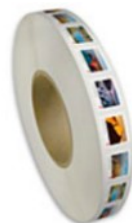
From Far and Wide (2020): Permanent™ domestic rate stamps - coil of 5,000