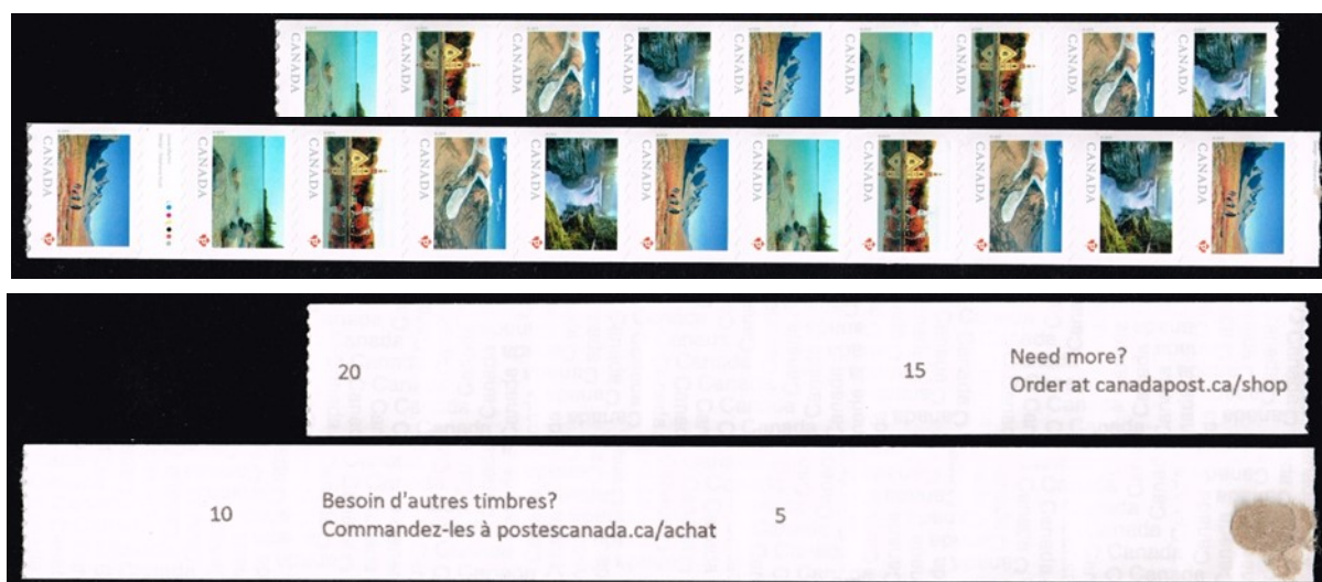
Abb. 3: Rollenende der Ausgabe 2019, Vor-/Rückseite

Laut Verkäuferin sind die Kleinrollen gänzlich ohne Verpackung. Zu meiner Freude konnte ich auch ein Rollenende erwerben. Die selbstklebenden Rollenmarken sind auf der Folienseite in 5er Schritten nummeriert. Hierbei ist interessant, dass zum Ende der Rolle der zweisprachige Hinweis „neue Briefmarken online zu bestellen“ erscheint. Des weiteren sind in Nordamerika Rollenmarken in der Regel seitlich geschnitten und nur zwischen den Marken „gezähnt“ bzw. mit einem Wellenzahn OHNE Zwischenraum verbunden. Nach jeder 20-igsten Marke befindet sich ein Zwischensteg, der vielleicht auch das Druckplattenende verbirgt.