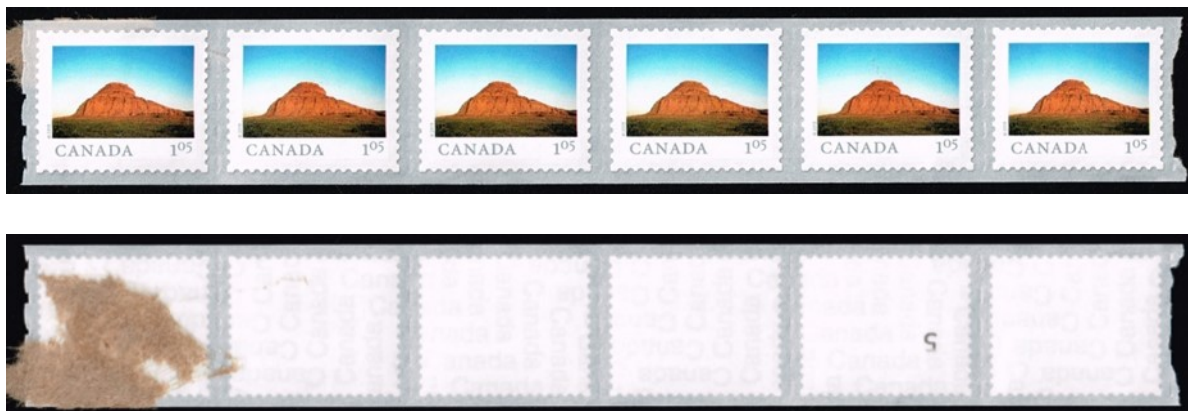
Abb. 6: Rollenende eines perforierten Selbstklebe-Rollenmarken-Streifens

Auch hier konnte ich von der Wertstufe 1,05$ ein Endstück erhalten. Schön zu sehen sind die kopfstehende Zählung „5“, die Klebereste der Papprolle sowie die maschinelle Trennung der Rolle neben der Folienperforation zwischen jeder Marke zum einzelnen Verkauf an der Kasse des „Tante-Emma-Ladens“. Fazit: der Kunde muss nicht ganze Rollen der selbstklebenden Variante kaufen. Nassklebende Briefmarken scheint es gänzlich nicht zu geben.