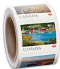
From Far and Wide (2020) : Permanent™ domestic rate stamps - coil of 100

In Canada gibt es Briefmarken mit und ohne Wertangaben. Letztere sind mit in einem roten Ahornblatt aus dem Kanadischen Wappen eingebettet „P“ versehen. Diese PERMANENT™-Briefmarke, wird immer zum aktuellen Inlandsportoppreis für Briefe bis 30g (z. Z. 0,92$) angenommen. Praktisch ist, dass es bei einer Portoerhöhung keiner Ergänzungswerte bedarf. Wenn Sie heute eine PERMANENT™-Briefmarke kaufen, können Sie diese jederzeit in der Zukunft verwenden. Es scheint derzeit so, dass jedes Jahr eine neue Rolle mit 5 wechselnden Bildern unter dem Titel „From Far and Wide“ (frei übersetzt „von nah und fern“) aus dem schönen Canada aufgelegt wird. Sie gibt es derzeit laut Internet als 100 und 5000 Rolle. Die Rollen-Abbildungen sind von 2020.